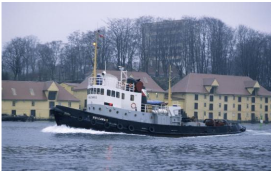
Slik så ”Vulcanus” ut med sine opprinnelige farger.

Som en del sikkert har fått med seg, er vi en liten gruppe rundt kystkultursenteret som nå prøver å redde ”Vulcanus” for byen. I forrige uke skrev BA om det, og BT på nettutgaven. I dag er det tre sider i BT.